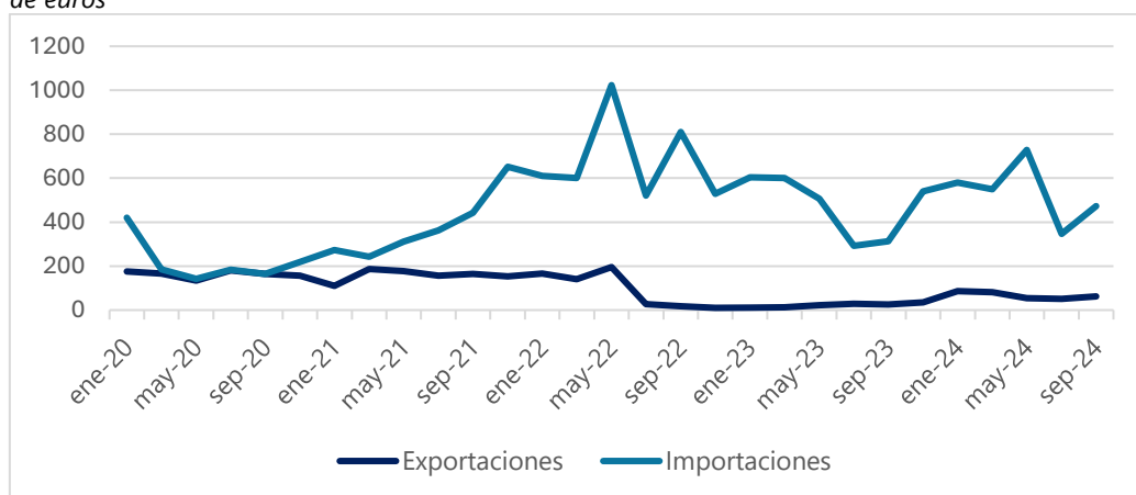
Gráfica 1: Evolución de las exportaciones e importaciones de España a Argelia del año 2020 al 2024; en millones de euros